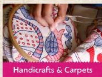
Handicrafts & Carpets