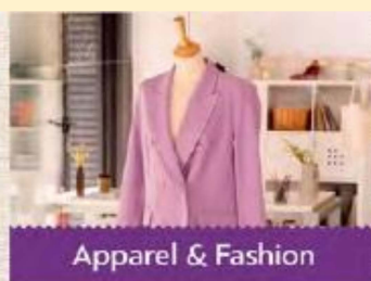
Apparel & Fashion